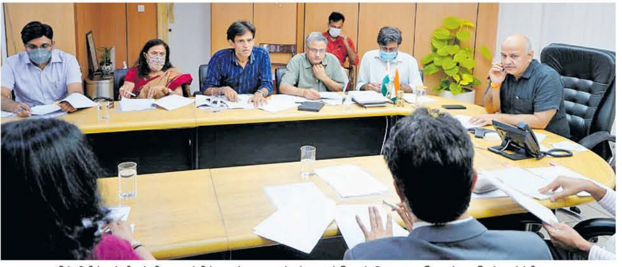
தில்லியில் பள்ளி கல்வி அமைப்பில் அடிப்படை மாற்றங்களைக் கொண்டு வருவது தொடர்பாக செவ்வாய்க்கிழமை ஆய்வுக் கூட்டம் நடத்திய துணை முதல்வர் மணீஷ் சிசோடியா.